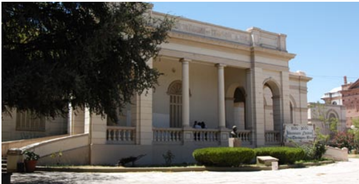
Escuela Normal Paula Dominguez de Bazán