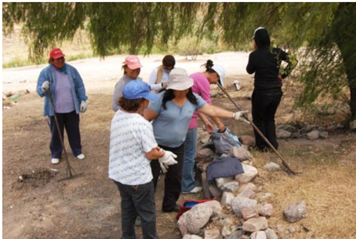
Trabajadoras del Plan de Inclusión Social.

Sin duda el cambio en los indicadores es consecuencia de la implementación de esta política social. Al analizar la variación de las tasas de desempleo considerando (y no considerando) los planes sociales, se observa la incidencia que tienen en el mercado de trabajo. Comparando con otras provincias de la región Cuyo y el resto del país la implementación de esta política resulta contundente como lo muestra la Tabla 1.11.