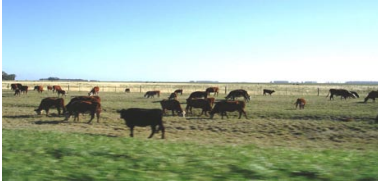
Zona ganadera sanluiseña