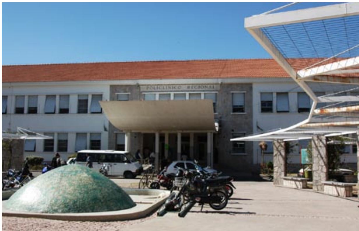
Policlínico Regional San Luis.

Sin pretender agotar la situación de la salud en la Provincia de San Luis, es pertinente hacer algunas consideraciones respecto a uno de los aspectos más sensibles de la salud como lo son la natalidad y la mortalidad infantil. La Tabla 1.15 muestra indicadores de natalidad, y mortalidad por jurisdicción de residencia en la República Argentina, entre otros, en donde se observa para San Luis una alta tasa de natalidad 19,3 respecto a la media nacional de 17,8 pero al mismo tiempo la tasa de mortalidad infantil puede considerarse alta 15,7 respecto a la nacional de 13,3.