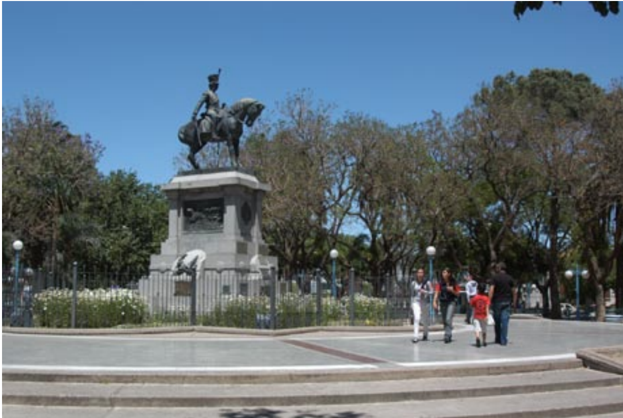
PLaza Pringles, San Luis

Según los informes del Ministerio del Interior de la Nación respecto de la situación general de la población argentina el ritmo de crecimiento de la población total viene en descenso, pues aunque la población crece, lo hace cada vez más lentamente. En Argentina entre 1980 y 1991 el aumento de la tasa de crecimiento medio anual fue del 14.7‰, en tanto que entre 1991 y 2001 el valor fue 10.1‰. Este descenso en el ritmo de crecimiento se reitera en la mayoría de las jurisdicciones del país. No obstante en San Luis,