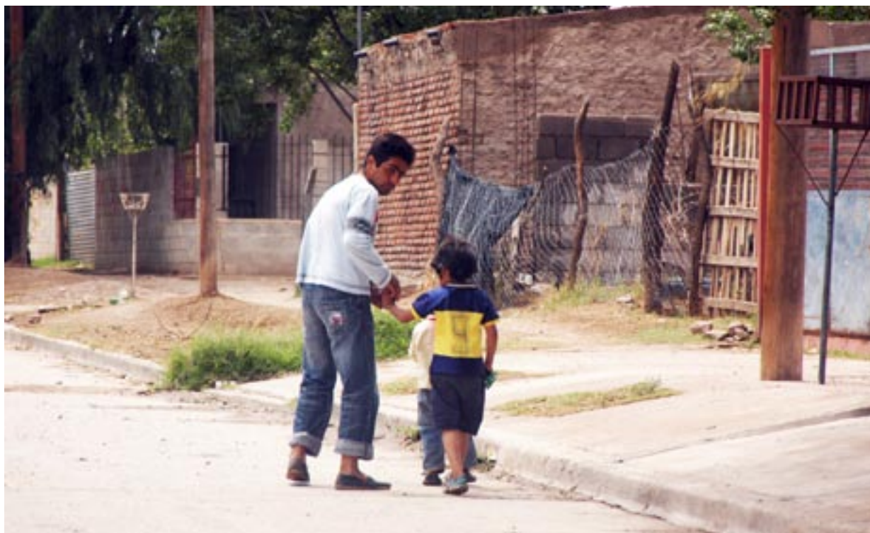
Barrio marginal de la ciudad de San Luis

Se trata de una medida gubernamental de focalización universal, es decir, que todo desempleado podía acceder al beneficio consistente en una asignación mensual conceptualizada como “ colaboración económica de carácter no remunerativo por todo concepto ” 2 y su asignación es de dependencia directa y discrecional del Poder Ejecutivo Provincial. Al inicio de su implementación aproximadamente 45.000 beneficiarios percibían una contribución mensual de $300. Esa remuneración se ha incrementado anualmente llegando al 2009 a ser de $600 por mes. Para ello, el gobierno de la provincia destinó en 2004 una asignación presupuestaria de 177 millones de pesos (aproximadamente un 25% del presupuesto provincial). En contraprestación los beneficiarios deben desarrollar tareas con una duración de ocho horas diarias, cinco días a la semana. En la práctica, los beneficiarios han sido destinados a la limpieza de parques, paseos públicos y la vera de las rutas, y son lentamente distribuidos en otras tareas administrativas del Estado. Pueden participar en talleres optativos coordinados por los mismos beneficiarios del plan (tejido, carpintería, folclore, cocina, alfabetización, artesanías, etc.). Como consecuencia de este Plan a partir de 2003 se percibe una notable mejora en la situación laboral en San Luis respecto de la década anterior. (Tabla 1.10)